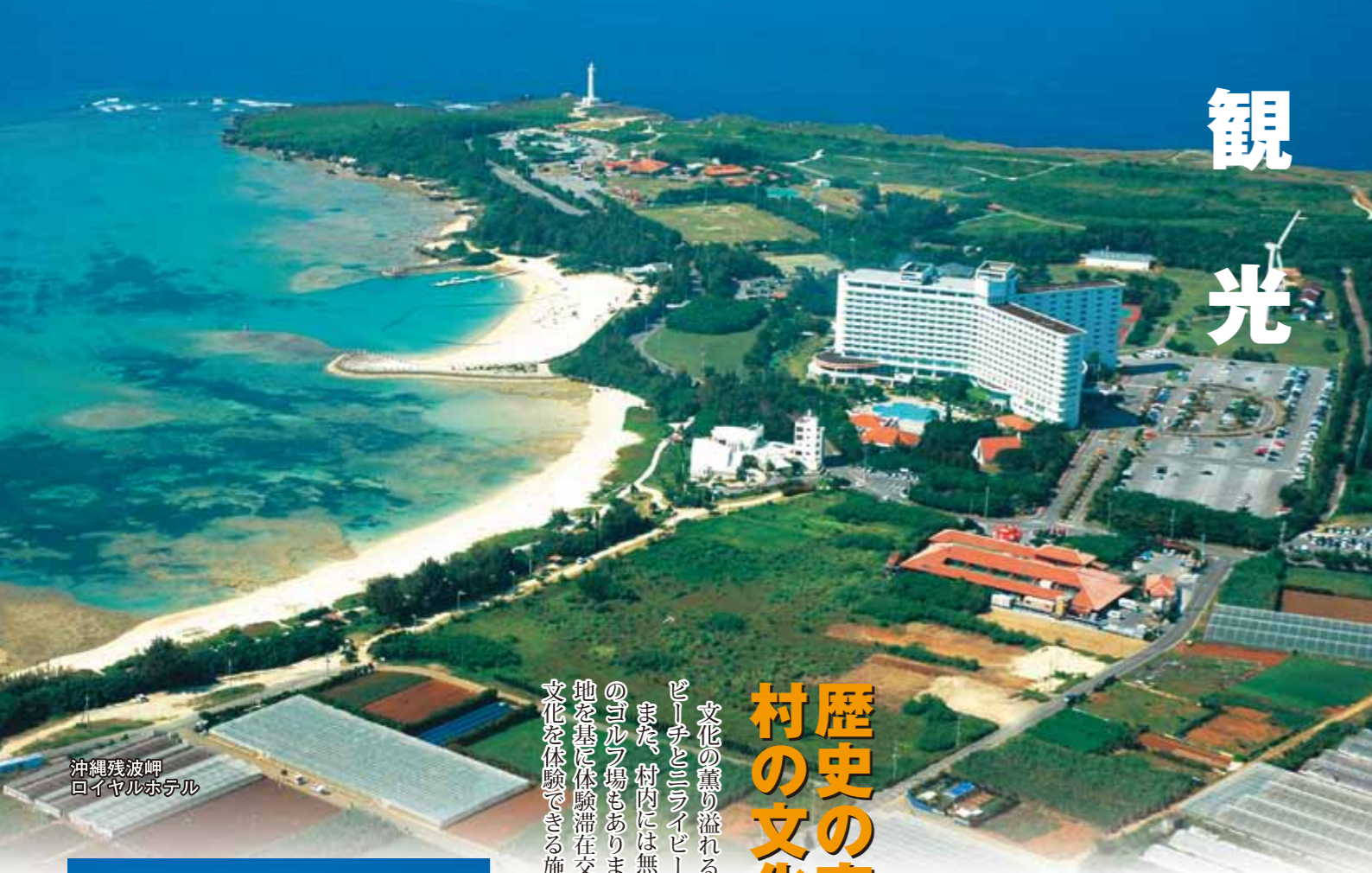
沖縄残波岬 ロイヤルホテル