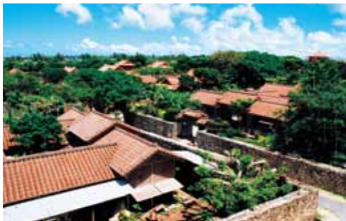
体験王国むら咲むら