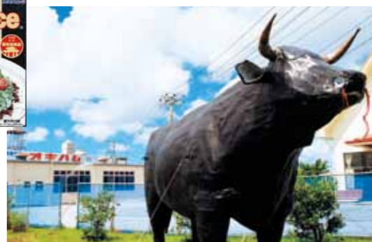
沖縄ハム総合食品