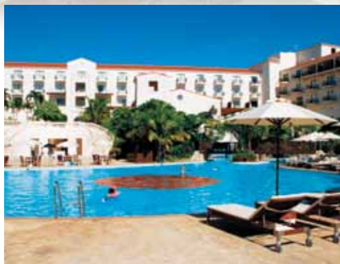
ホテル日航アリビラ