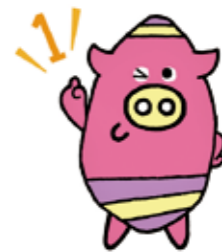
「よみたんブランド」 パワーアップキャラクター よみとん

一九八四年、読谷村商工会を中心 に、村おこし事業がはじまりました。 以来、特産品である「『紅いも』で村 おこしを」を合言葉にシンポジウムや 物産展を開催し、今日の「紅いもの 里」を築き上げてきました。 村商工会は、「永続的に地域づくり に取り組む組織」の設立を検討し、一 九九二年に村民から出資者を募り「ユ ンタンザ」を誕生させました。以来、 紅いもペーストをはじめ新たな特産品 開発と販路開拓を事業として取り組ん でいます。 紅いも菓子を中心として営業する 「御菓子御殿」は、全国的に販路拡大 を図っており、二〇〇三年、オンリー ワン賞を受賞。パッケージでもお菓子