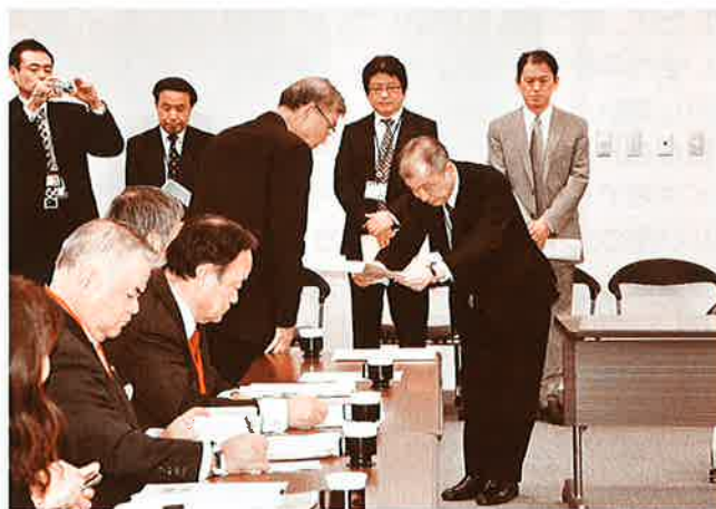
防衛省地方協力局次長へ要請文を渡す

今回の要請行動は、衆議院解散総選挙、政権交代、国会開催と慌ただしい中での抗議要請行動となり、事務官僚への訴えとなりました。しかしながら老人会、婦人会、青年会の各階層、商工会をはじめとする各団体と共に、東京霞ヶ関中枢とアメリカ大使館へ沖縄の置かれている現状を訴えることが出来たことは、大きな意義があったと思います。