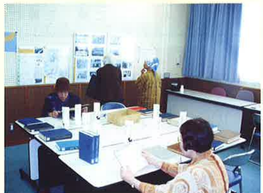
村立図書館で行った紡績社史ミニ展示会