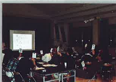
座喜味城跡周辺地区まちづくり懇談会