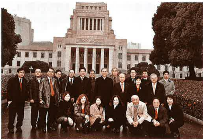
東京抗議要請行動代表団（国会議事堂前にて）

在日米軍基地の74%が狭隘な沖縄に存在するということが、とりもなおさず基地問題に対し抗議の声をあげ続けなければならない厳しい実態を招いています。今後も、この沖縄の現状を打開するための持続的な展開が必要であり、今回の抗議要請団に青年各層が多く含まれ、各省庁にて意見が述べられたことは、将来の取り組みに向けて効果的な成果があったと考えております。