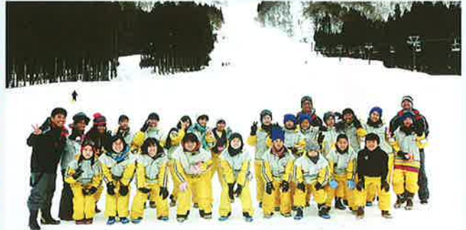
岐阜県白川村子ども会交流 スキー場での様子