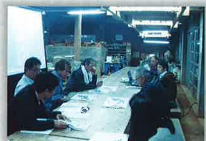
ヤチムンの里地区まちづくり懇談会