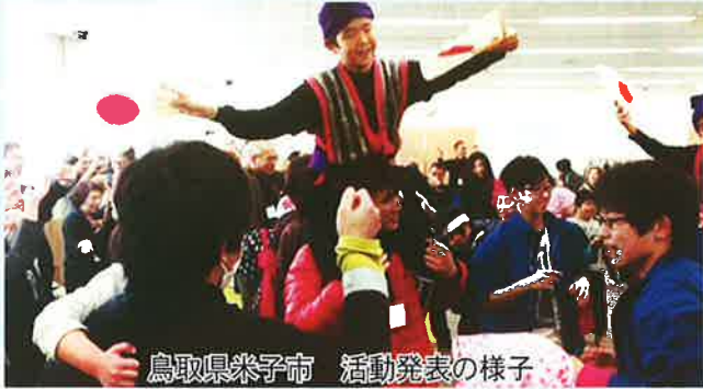
鳥取県米子市 活動発表の様子

また、2月15日(金)～18日(月)の間、世界遺産の白川郷で有名な岐阜県白川村との第1回子ども会交流事業に各字子ども会代表20名が参加しました。子どもたちは初めて見る雪に興奮しながら、白川村の子どもたちからスキーを教わり、雪景色の中で、沖縄ではできない体験に終始笑顔でした。芸能交流会では白川村の子どもたちは民謡の「古大神」を、読谷村の子どもたちは座喜味のエイサーを披露し、素晴らしい交流会となりました。