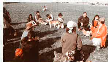
犬の飼い方の相談

犬の登録1回と毎年の狂犬病予防注射は、狂犬病予防法で定められた飼い主の義務です。