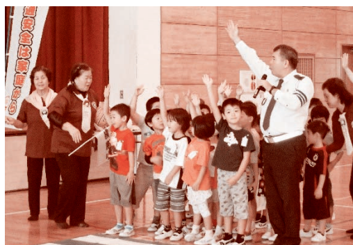
◀左記写真は古堅小学校での交通安全指導