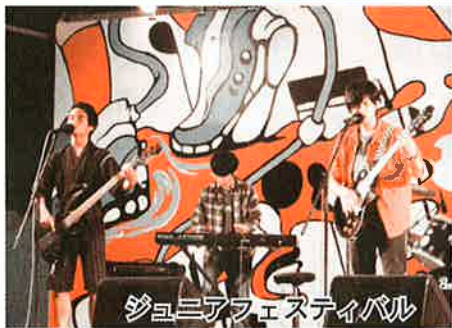
ジュニアフェスティバル