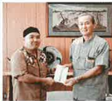
9月20日、熊本地震災害義援金として、株式会社御菓子御殿より50万円の寄付がありました。ご厚志に感謝申し上げます。

願書配布：本校にて配布します。 ホームページにも掲載します。 お問い合わせ：9時～17時(金・土・祝日除く)