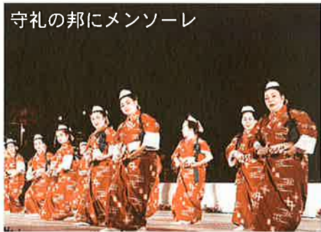
守礼の邦にメンソーレ