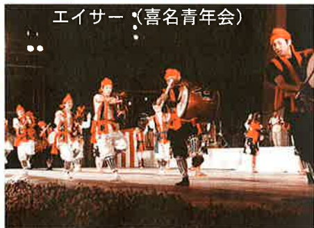
エイサー (喜名青年会)