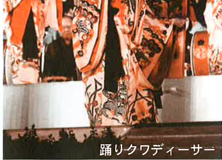
踊りクワディーサー