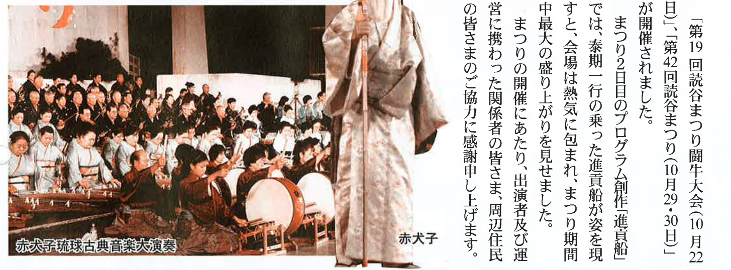
赤犬子琉球古典音楽大演奏