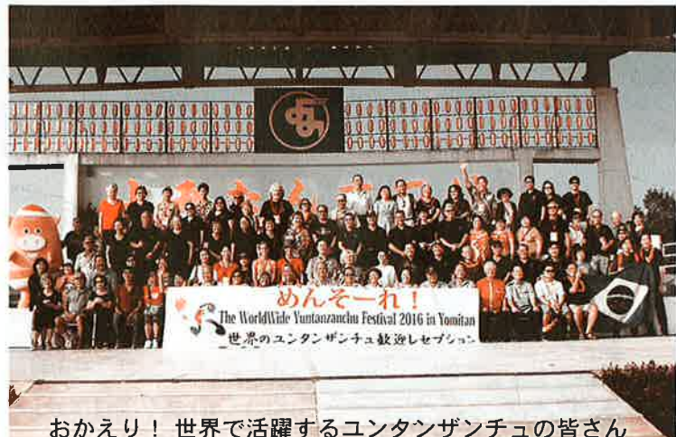
おかえり！世界で活躍するユンタンザンチュの皆さん