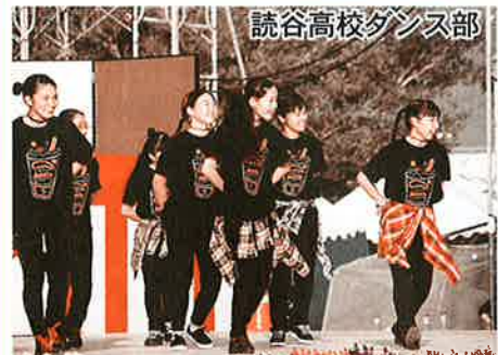
読谷高校ダンス部