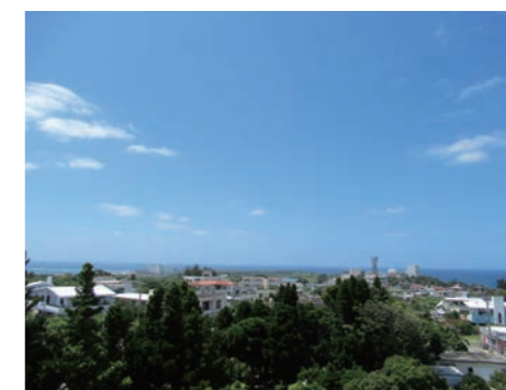
瀬名波公民館屋上からの景色

現在では、県道6号線から残波岬向けにも住宅開発が進み、それに伴い人口も増えてきています。