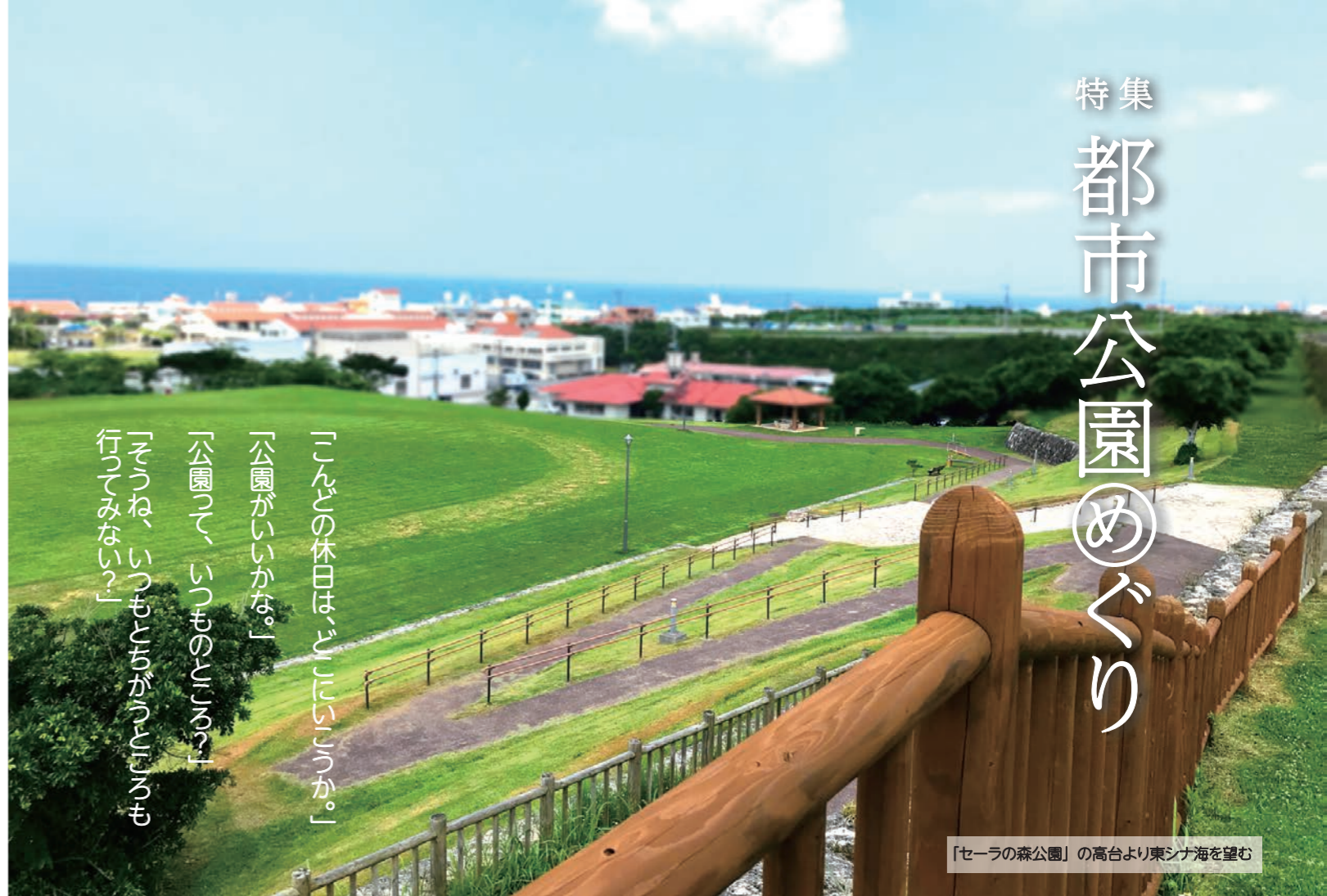
「セーラの森公園」の高台より東シナ海を望む

「公園って、公園じゃないか。」 「公園って、公園じゃないか。」 「公園って、公園じゃないか。」 「公園って、公園じゃないか。」