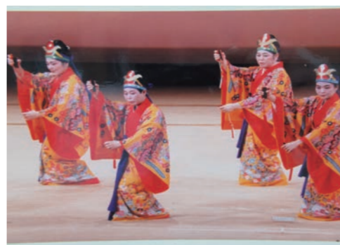
真福地のはいちょう