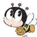
生涯学習の イメージキャラクター 「マナビィ」