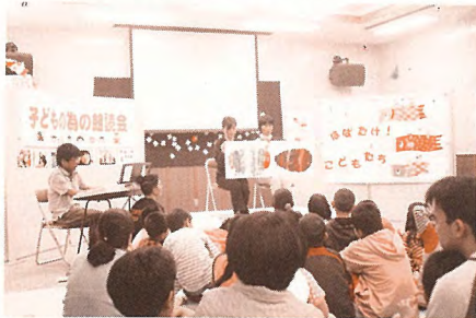
レインボー会による「はらぺこあおむし」の実演 BGM演奏：砂辺絢斗氏