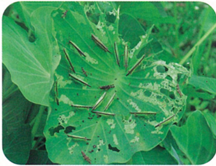
写真説明：ミズイモの葉上の成虫と幼虫

ミズイモはサトイモの仲間。別名イモ（田芋）、方言でターンムと呼んでいます。沖縄ではかなり古い時代からつくられていたようです。サトイモ（チンヌク）は畑で栽培され、ミズイモは水田で栽培されます。ミズイモを使った料理は沖縄のお祝いや法事に欠かせません。イモはディンガク（田芋田楽）に、若い葉柄や茎（すいき、ムジ）はドウルワカシーやお汁にします。宜野湾市の大山や金武町が有名なミズイモの産地です。読谷村ではあまり作ら