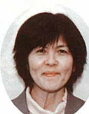
真栄田ミサ工 (波平)