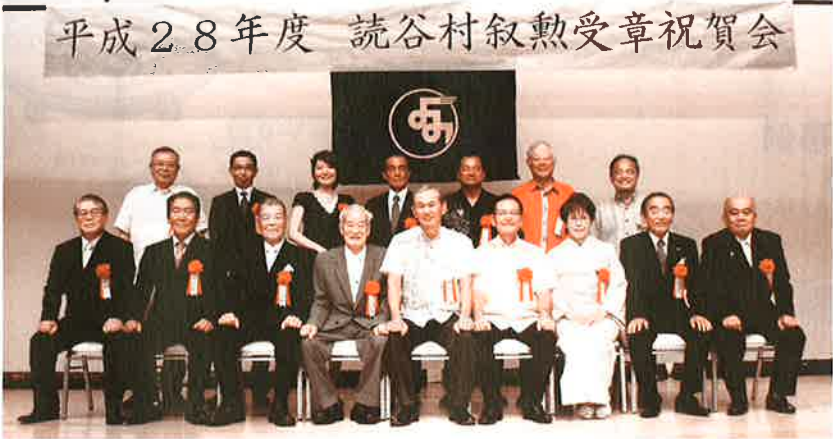
平成28年度 読谷村叙勲受章祝賀会

7月26日、平成28年度読谷村叙勲受章祝賀会が沖縄残波岬ロイヤルホテルで盛大に挙行されました。