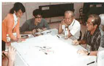
◎地図を見ながら意見交換!

現在、大木地区では土地区画整理事業による快適で住みやすい住環境整備を進めています。その一環として、地権者の皆さまの中から参加者を募集し、平成27年7月から平成28年1月までの約半年間で全5回のワークショップと2回の県内事例視察を行い、まちのルールについて検討を重ねました!