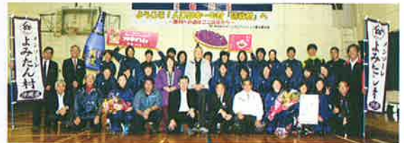
日立ソフト ボール部