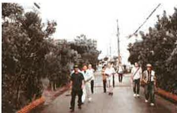
◎県内事例視察 in 北谷