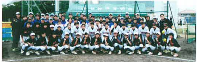
豊田自動織機シャイニング・ベガ