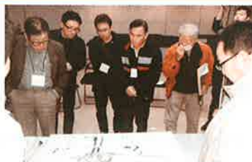
◎模型を見ながらまちの完成をイメージ!