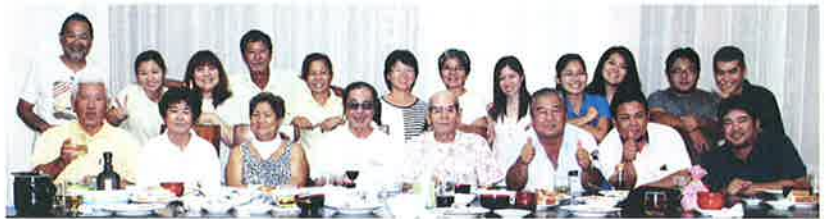
第2移住地での歓迎会

1954年6月、那覇港から第1次ポリビア移民が出発した。これは琉球政府の計画した集団移民で、1964年の第19次までで、687家族（単身者含む）、2,229人が渡航した。読谷村からは60