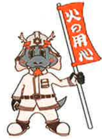
ニライ消防公式キャラクター ニライ君