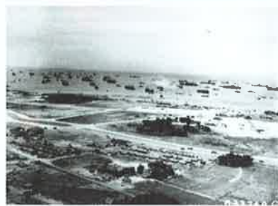
1945.5.1 沖縄西海岸に集合した船舶。この場所は「パープルビーチ」と呼ばれ、米軍が最初に上陸を果たした場所である。

出発は明け方なので米軍の空襲や艦砲射撃はありませんが、帰りは空襲と艦砲射撃のなかを駆ける命がけの任務でした。爆風で耳が痛くならないよう耳に