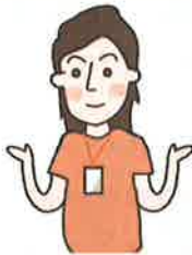
サポーター (オレンジTシャツが目印)

A：健康保険での健診受診が義務づけられています。 職場での健診結果のコピーを役場に提出することで、受診率へ反映することができます。 ぜひご協力ください。