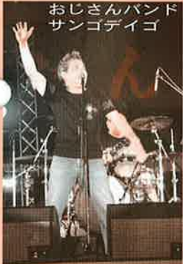
おじさんバンド サンゴデゴ