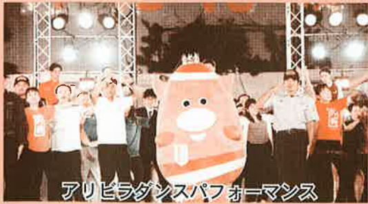
アヒラダンスパフォーマンス