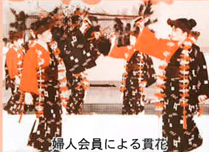
婦人会員による貫花