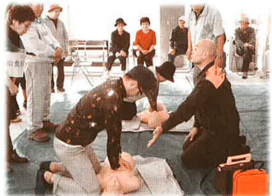
渡具知（心肺蘇生訓練）