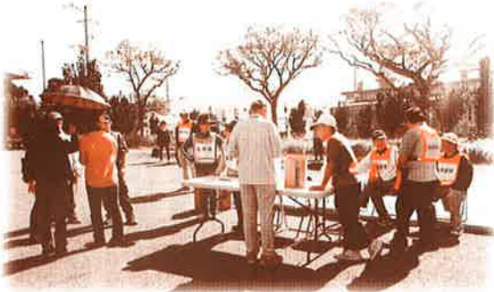
マックスバリユ（都屋店）駐車場