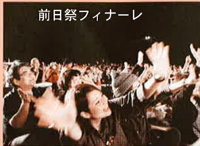
前日祭フィナーレ