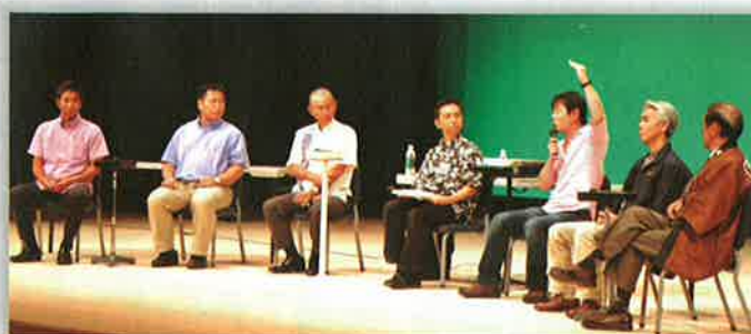
シンポジウムの様子