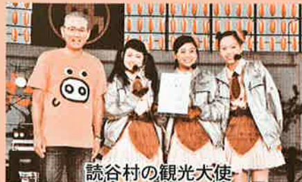
読谷村の観光大使

今年で読谷まつりは40周年を迎えました。記念に開催された前日祭ではよみとんのお披露目やよみとんの音楽祭が催され、村内外のアーティストなどによるライブやダンスパフォーマンスで会場は大盛り上がりを見せました。 初日は村内小中学校の児童・生徒による集団演技や「赤犬子琉球古典音楽大演奏会」などが演じられました。2日目は「闘牛大会」(むら咲むら闘牛場)や、人口日本一の村記念イベント「弾こう! みんなで三線を」、大交易時代のロマンと勇姿を再現した創作「進貢船」などが繰り広げられました。 前日祭から3日間、まつりは多くの来場者で賑わい、大成功で幕を閉じました。