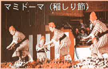
マミドーマ (稲しり節)