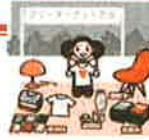
*くわしくは、図書館にて!

10月11日(土)図書館フェスタにて、キッズフリーマーケットを開催します。読み終わった本やマンガ、カードなどを自分で出店してみませんか?出店前におこづかい帳のワークショップもあります。