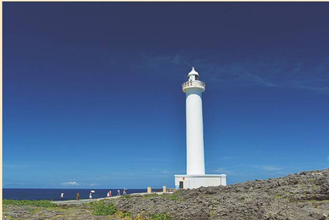
平成24年度読谷村長賞受賞作品 デジタルカメラ部門 神奈川県 川崎様

【各賞】読谷村長賞、那覇海上保安部長賞、第十一管区海上保安部長賞、沖縄県知事賞を決定します。