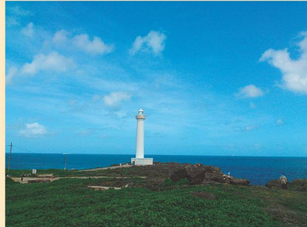
平成24年度読谷村長賞受賞作品 カメラ機能付携帯電話部門 読谷村 系数様

※受賞作品の発表、応募上の注意点など詳しくは那覇海上保安部又は役場商工観光課までお問い合わせください。