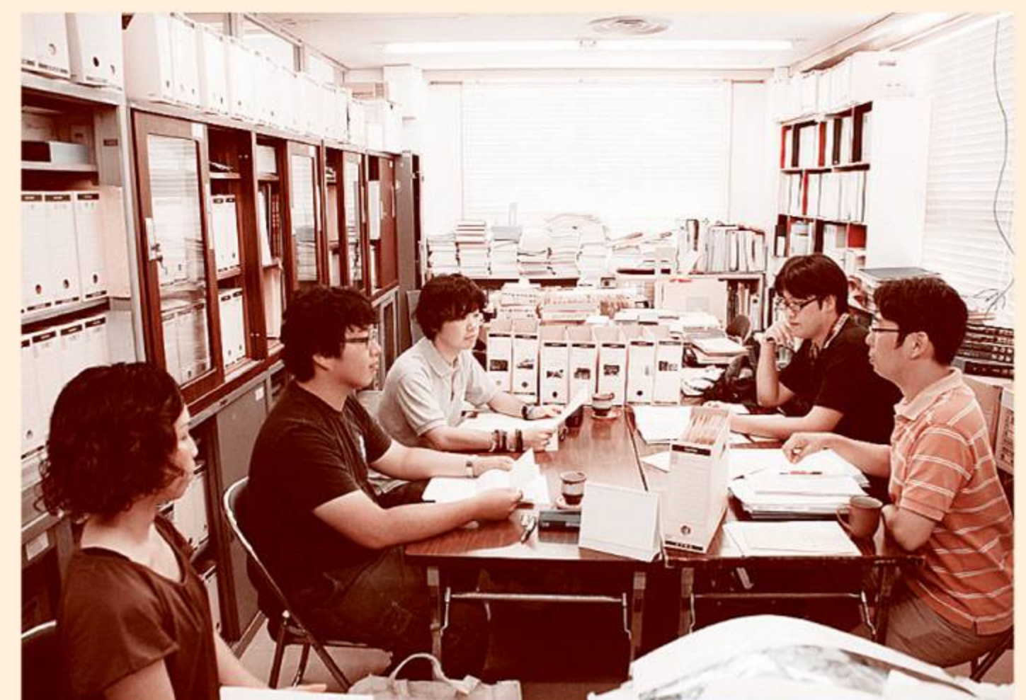
調査員の証言読み合わせ