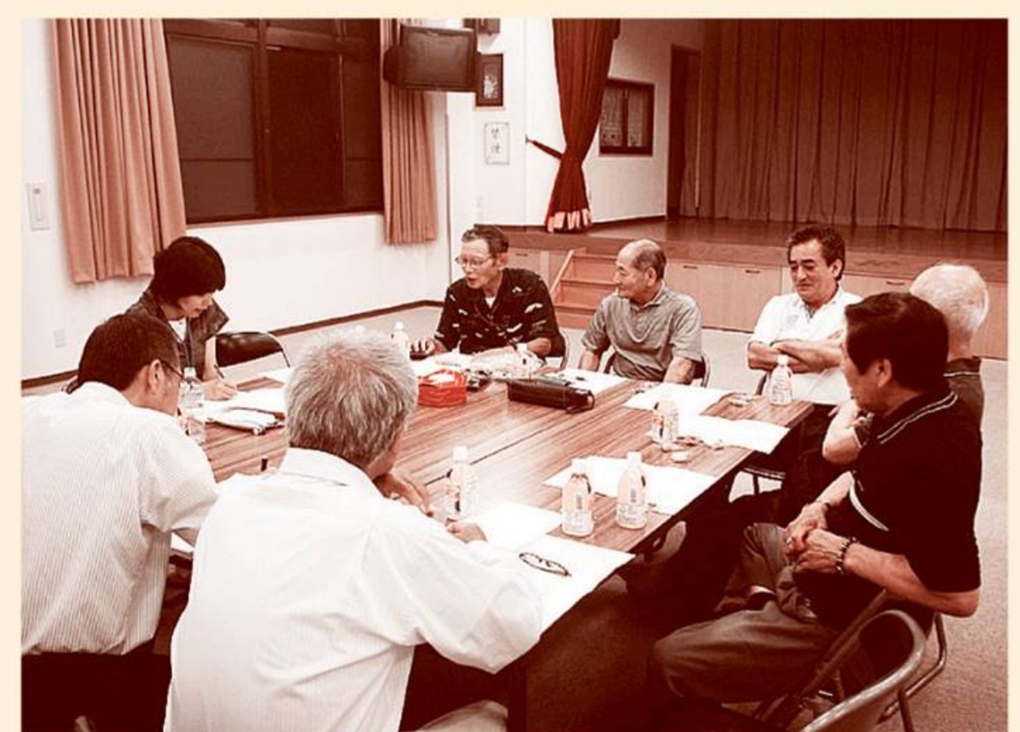
関西地区読谷郷友会の方々と調査打合せ（兵庫県尼崎市）