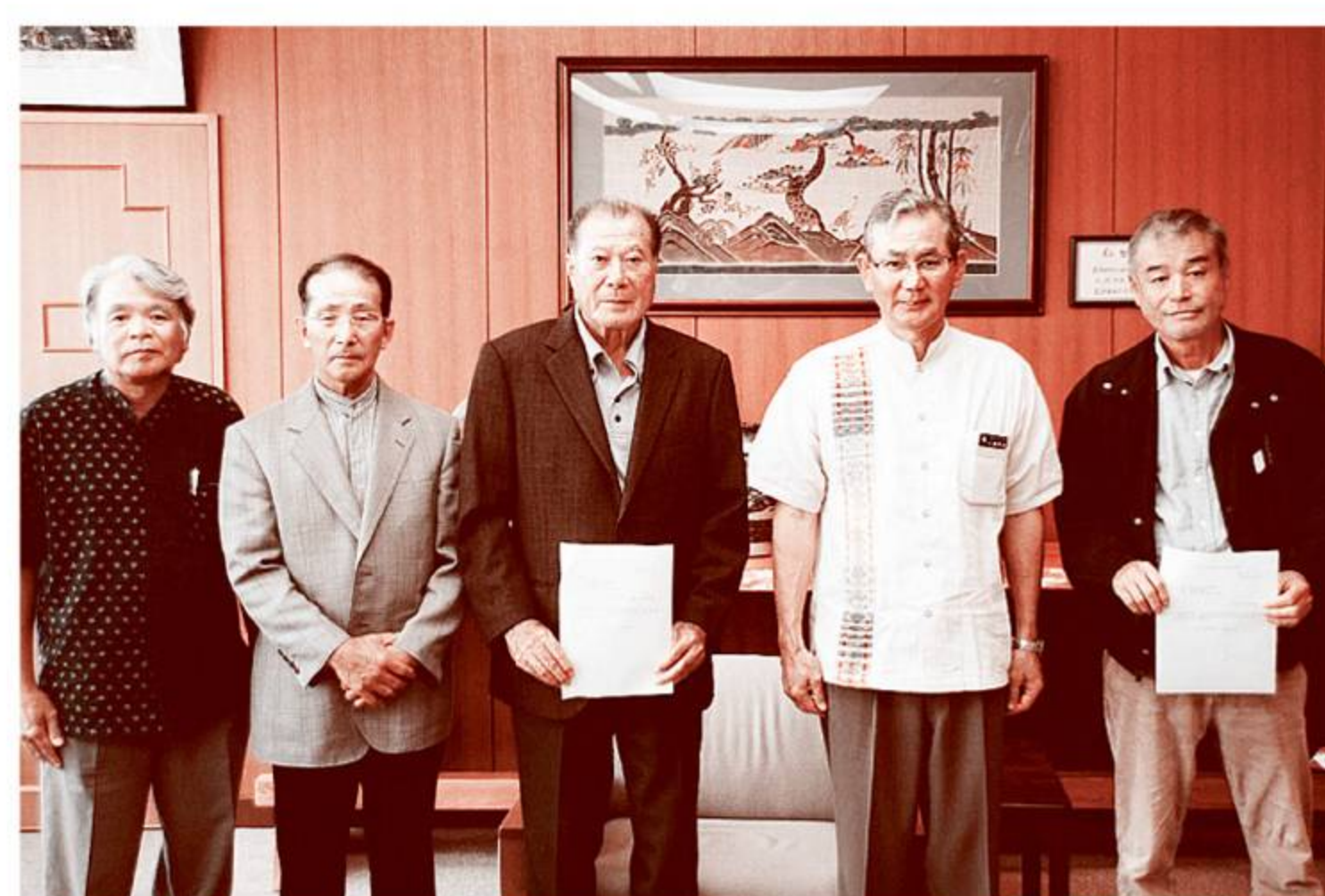
お問い合わせ 読谷村役場 3階企画財政課 ☎982-9205

A 申請書様式を企画財政課で受け取り（ホームページからダウンロード可）その他必要書類を揃えて企画財政課までお申し込みください。