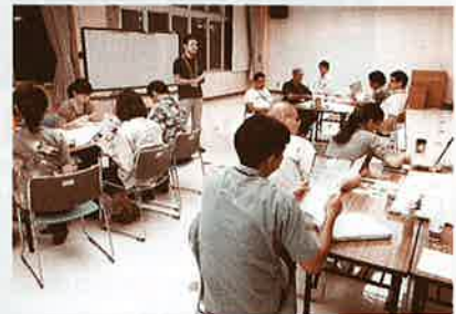
▲第21回村民ユンタク会の様子

今後も、村民ユンタク会は勉強会や対話集会等を行いながら、読谷村自治基本条例原案の策定に向けて取り組んでまいります。