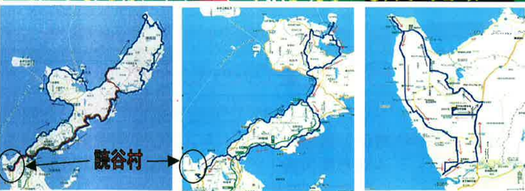
ダイナミックコース