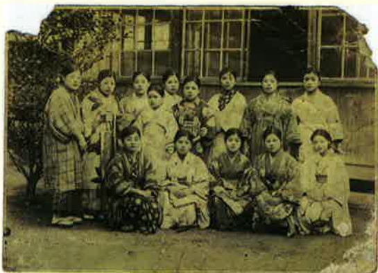
兵庫県飾磨(しかも)の紡績で。1938(昭和13)年頃。一人を除き渡慶次校区(渡慶次・備間・宇座)出身者。