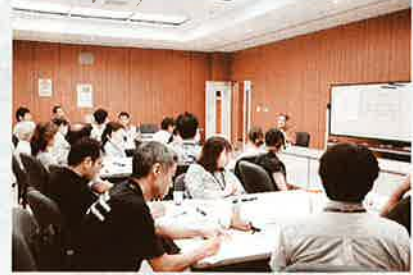
▲第20回村民ユンタク会の様子

村民ユンタク委員からは、「議会や選挙以外での議員の活動をあまりよく知らなかったが、今回直接話を聞くことができ議員の仕事というものを知ることができた」、「読谷村を良くしていきたいという思いは一緒だということを実感することができた」等の感想がありました。