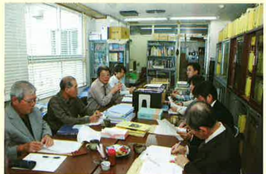
移民・出稼ぎ編専門部会。読谷の特色ある村史に向けて活発な議論が行われています。