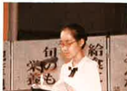
受賞者本人による 作文の朗読もありました。