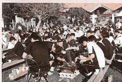
▲今年も盛況の牛一頭丸焼きパーティー

12日（日）には、第11回牛一頭丸焼きパーティーが役場中庭で開催され、500名以上の参加者が中日ドラゴンズの選手とともに食事を楽しんだほか、抽選会でサイン入りバットなどのドラゴンズグッズが当たるなど、交流の場となりました。16日（木）には中日ドラゴンズのマスコットキャラクターのドアラが読谷山花織のウッチャキを身にまとい役場を訪問し、村長と並んで三線にもチャレンジしました。