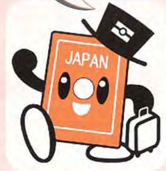
パスポートのイメージキャラクター パスポくん

読谷村に住所登録している方・居所のある方は、読谷村役場での手続きとなり、原則として県旅券センターでの手続きができなくなりますので、ご注意下さい。