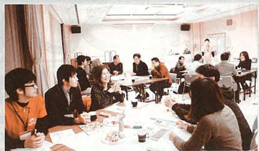
▲ゲーム後の和やかな雰囲気（第9回）

出席者からは、もっとうち解けた雰囲気でも話し合えるようになるためにどうすればよいか、自治基本条例制定というゴールに向けて、具体的にどうスケジュールをたてていくかなどの意見交換がなされました。