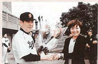
▲中日ドラゴンズキャンプイン

今年の読谷村は、昨年完成した陸上競技場の効果もあり、プロ・アマ含め野球、ソフトボール、陸上競技にサッカーとスポーツの話題が満載です。