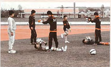
▲慶應義塾大学サッカー部少年サッカー教室

属する慶應義塾大学サッカー部（正式名称）がキャンプを行い、同部は18日（土）に読谷・古堅中学校のサッカー部約50名を指導しました。