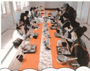
12月にはお正月料理を作りました