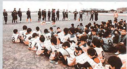
▲サガン鳥栖少年サッカー教室

属する慶應義塾大学サッカー部（正式名称）がキャンプを行い、同部は18日（土）に読谷・古堅中学校のサッカー部約50名を指導しました。