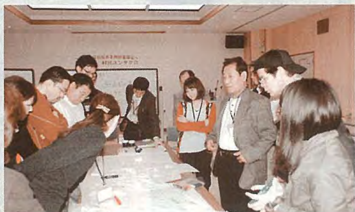
▲ワークショップに真剣に取り組む（第10回）

出席者それぞれが、自治基本条例に対する考えや思いを話し合う中で浮かびあがったテーマを整理し、これらを自治情報共有、住民意識などいくつかの分類にとりまとめました。