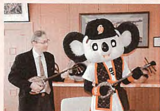
▲ドアラが三線にチャレンジ

次に、サッカーの話題です。昨年J1に昇格したサガン鳥栖（佐賀県）が、2月1日～11日にかけて陸上競技場で初キャンプを行いました。キャンプ前日の1月31日（火）には、村長をはじめ多くの関係者が那覇空港で到着したチームを盛大に出迎えました。2月4日（土）には村内の少年サッカー5チームから小学3・4年生約100名が参加しての少年サッカー教室が開催され、プロの技術を学びました。また、2月13日～19日にかけて関東大学リーグに所