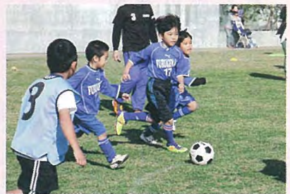
▲まなびフェスタカップ

会場では手作りキャンドルやおもしろ科学実験などの体験コーナーや、村内各団体の活動の展示、サークルの発表会などさまざまなイベントを多く催し、こどもから大人まで思い思いに楽しんでいました。