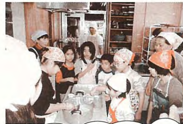
地域の子もたちと調理実習

お問い合わせ 読谷村食生活改善推進協議会事務局 役場1階 健康環境課 ☎982-9211