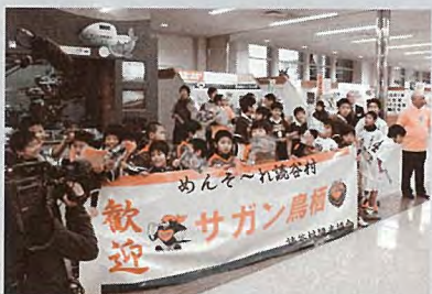
▲サガン鳥栖を那覇空港で熱烈歓迎

次に、サッカーの話題です。昨年J1に昇格したサガン鳥栖（佐賀県）が、2月1日～11日にかけて陸上競技場で初キャンプを行いました。キャンプ前日の1月31日（火）には、村長をはじめ多くの関係者が那覇空港で到着したチームを盛大に出迎えました。2月4日（土）には村内の少年サッカー5チームから小学3・4年生約100名が参加しての少年サッカー教室が開催され、プロの技術を学びました。また、2月13日～19日にかけて関東大学リーグに所