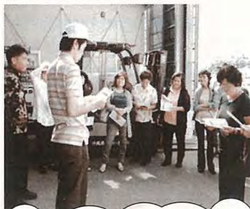
南城市へ健康づくり視察研修