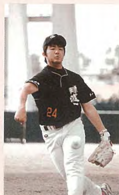
▲昨年のちゅーばーリーグ

また、ソフトボールは2つの大会が行われます。まず、3月10日と11日の2日間、第10回春期ソフトボール強化リーグ「ちゅーばーリーグ」が総合運動広場を主な会場として開催されます。今回は県内から5チーム、県外から5チームが参加し、いずれも優勝目指して熱い戦いを繰り広げます。村内からも3チームが参加予定です。また、4月20日～23日にかけて、60歳以上の方が参加する「第30回シニア・第18回古希全国シニアソフトボール沖縄読谷大会」も開催されます。全国から多くのソフトボール愛好家が集まる大会ですので、村民の皆様もぜひご来場ください。