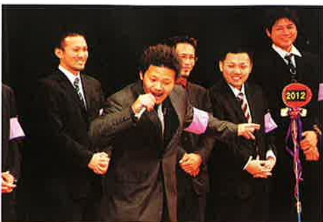
▲各字青年会が新成人へ祝福のメッセージを送る

波によるマーチングやYAKUBAファミリーストリートダンスが式典に花を添え、思い出のビデオアルバムや恩師からのメッセージでは当時の思い出を振りかえっていました。