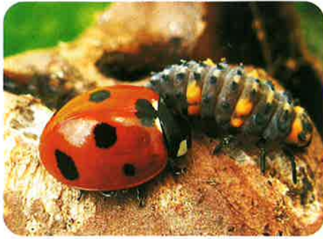
写真説明：幼虫（右）と成虫（左）

テントウムシはよく知られた昆虫の一つでしょう。テントウムシには、虫を食べる肉食のもの、葉をたべる植食性のものがいますが、多くは肉食です。一般に、体がつやつやしているのが肉食性のテントウムシで、つやがないのが植食性のテントウムシです。ナナホシテントウムシは赤色に7つの黒い紋があり、テントウムシ