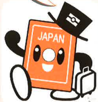
パスポートのイメージキャラクター パスポくん

役場1階 住民年金課 ☎ 982-9207 沖縄県旅券センター ☎ 866-2775