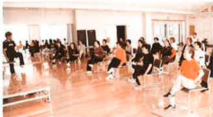
▲健康増進センターでの貯筋運動の様子

講座では、筋力が衰え、歩行などの日常動作が遅くなっていた高齢者が、1ヶ月間貯筋運動を行うことで、以前にも増して早く歩けるようになった事例がビデオで上映され、会場からは驚きの声が上がりました。後半には参加者が実際に貯筋運動を体験し、普段使わない筋肉を動かして貯筋に励みました。