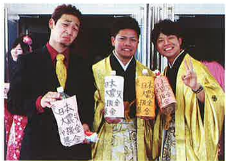
▲成人式実行委員会による募金活動

また、式典の最後にはカチャーシーが行われ、新成人を会場全体で祝福しました。今回より、各字青年会の先輩方からの激励のメッセージとエイサーの演舞が行われ、成人式を大いに盛り上げてくれました。また、新成人による10秒メッセージにて、成人式実行委員会より、東日本大震災義援金への呼びかけがなされ、合計20,464円が集まり、赤十字へ寄附されました。