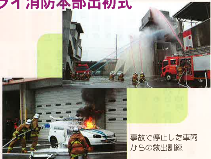
事故で停止した車両からの救出訓練

式典終了後は破壊救出などの展示訓練も行われたほか、式典の最後には一斉放水が行われました。