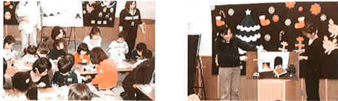
☆クリスマスツリーの工作☆ ☆絵本の読み語り☆

昨年12月18日(日)に、「子どもの為の朗読会」を行いました。絵本の読み語り、手遊び、ブラックシアターや音楽など盛りだくさんの内容に、参加した子どもたちも楽しんでいました。朗読会の終わりには、小さなクリスマスツリーを作成し、それぞれ思いおもいのツリーを作成しました。