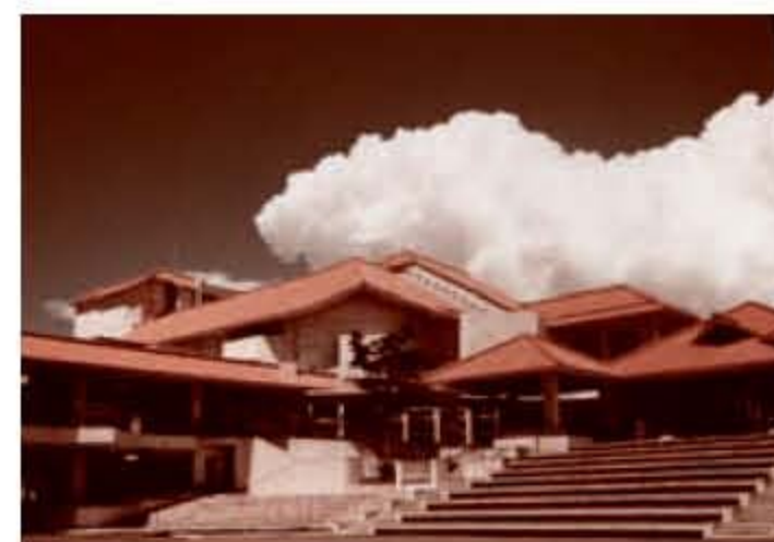
文化センター（平成10年）