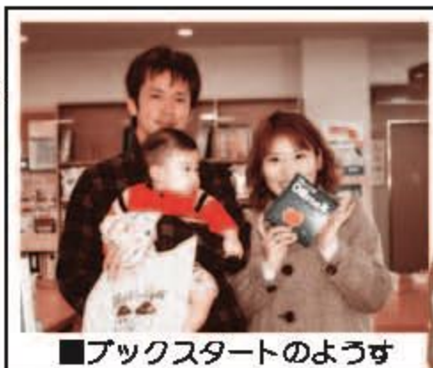
■ブックスタートのようす