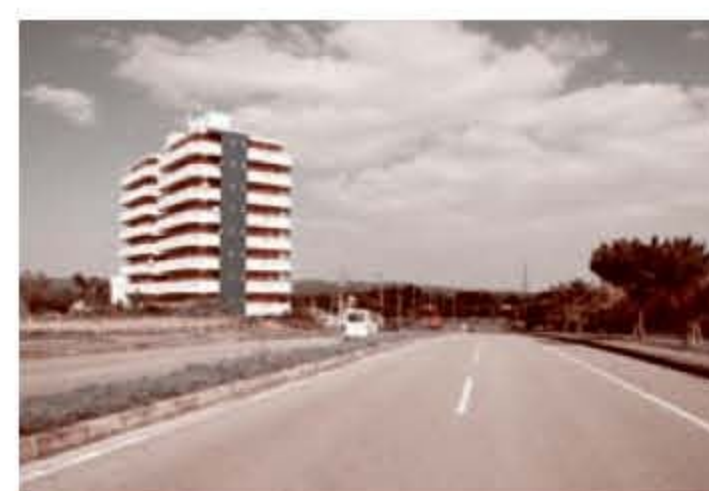
村道中央残波線（平成17年）