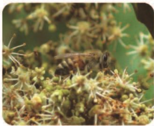
レイシの花で蜜集め

ヨーロッパ産のミツバチで、日本には明治時代に導入されました。ミツバチは蜂蜜やローヤルゼリーなどを取るために飼われていますが、イチゴなどの花粉媒介のためにも使われます。ミツバチの巣の中には、1匹の女王バチと約2万匹の働きバチ、多い時で全体の1割程度の雄バチがいます。女王バチは多いと