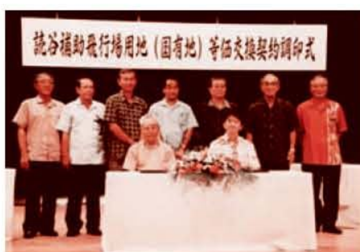
読谷補助飛行場跡地全面返還（平成18年）