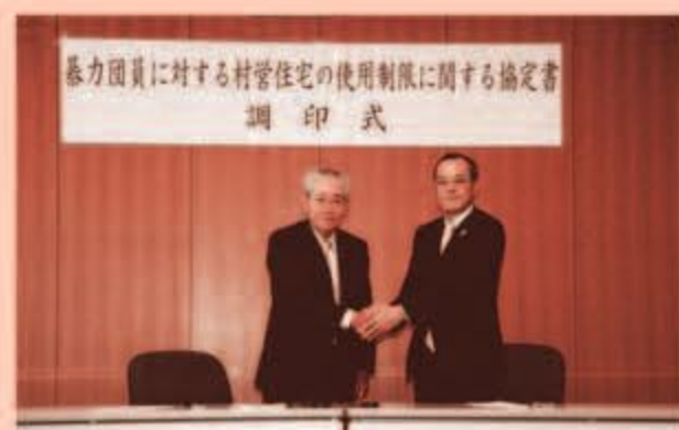
平成21年11月25日(水)に行われた調印式

また、平成21年11月25日(水)には「暴力団員による村営住宅の使用制限に係る協定書」の調印式があり、読谷村と嘉手納警察署との間で協定が結ばれています。この協定により、必要な情報が嘉手納署から提供されるため、村営住宅への暴力団員の入居を防ぐことができます。