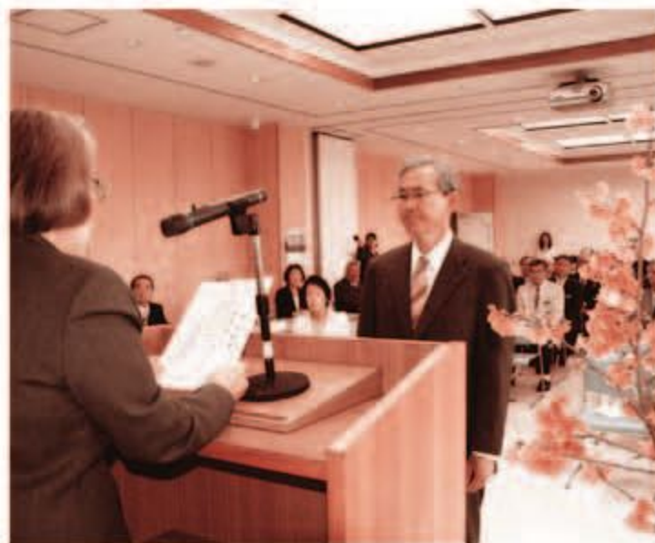
石嶺村長に当選証書が授与される

どうか、読谷村のさらなる発展のために、村民の皆様のご支援ご鞭撻のほどを心からお願い申し上げまして、就任のあいさつといたします。