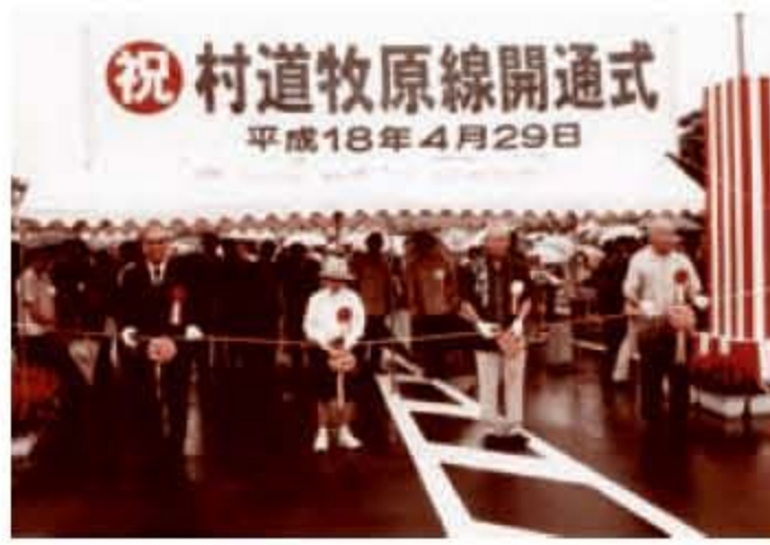
村道牧原線（平成18年）