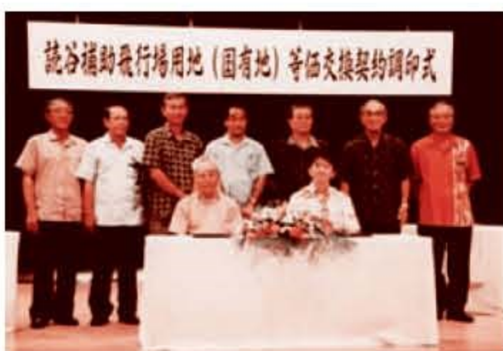
読谷補助飛行場跡地全面返還（平成18年）