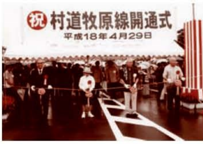
村道牧原線（平成18年）