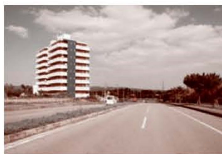
村道中央残波線（平成17年）