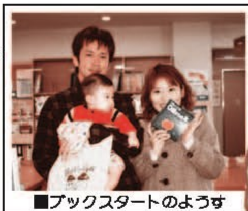
■ブックスタートのようす