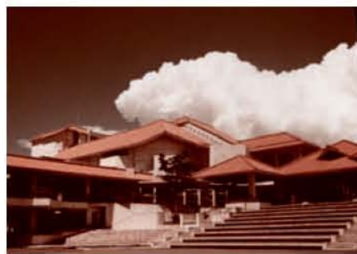
文化センター（平成10年）