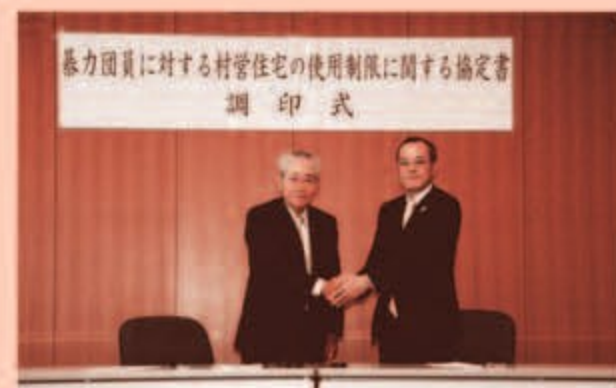
平成21年11月25日(水)に行われた調印式

また、平成21年11月25日(水)には「暴力団員による村営住宅の使用制限に係る協定書」の調印式があり、読谷村と嘉手納警察署との間で協定が結ばれています。この協定により、必要な情報が嘉手納署から提供されるため、村営住宅への暴力団員の入居を防ぐことができます。