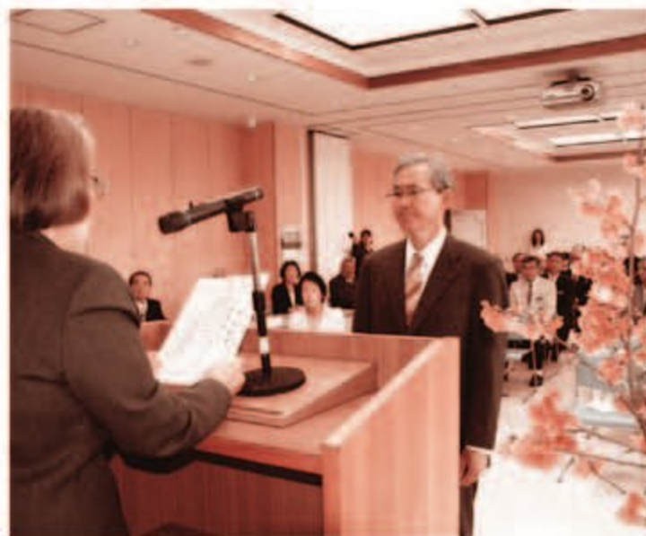
石嶺村長に当選証書が授与される

どうか、読谷村のさらなる発展のために、村民の皆様のご支援ご鞭撻のほどを心からお願い申し上げまして、就任のあいさつといたします。