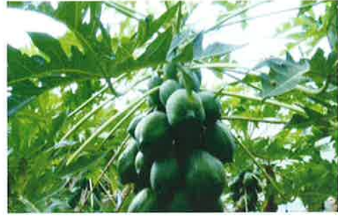
問題のないパパイヤ