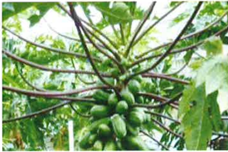
未承認の遺伝子組換えと疑われるパパイヤ

庭先や道端で未承認遺伝子組換えパパイヤと疑われる株があった場合は、以下の連絡先まで情報提供をお願いします。