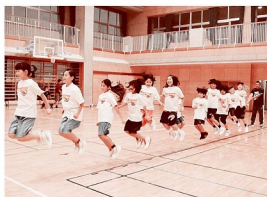
ロープ・ジャンプ・X大会

チャレンジデーをきっかけに、これからも健康な村づくりに村民一丸となって取り組んでいきたいと思います。