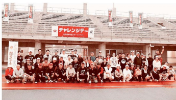
おはようウォーキング大会