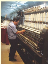
展示されている紡績機械 (リング・精紡機)

5月12日から東京・神奈川・愛知で移民・出稼ぎ調査をしてきました。今回は国立国会図書館（千代田区）、トヨタテクノロジーミュージアム（名古屋市中区）の資料調査および、横浜市鶴見区や都内で南米から帰国した方と本土就職した方の聞き取り調査でした。