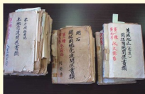
八重山移民の貴重な資料