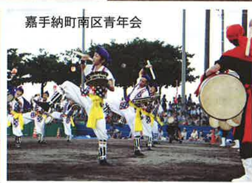
嘉手納町南区青年会