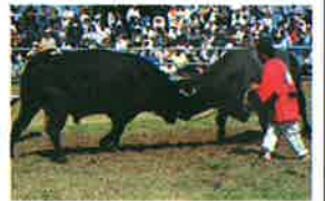
■読谷むら咲むら闘牛場