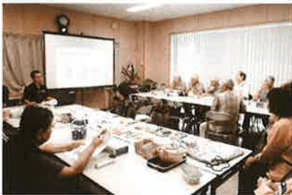
8月28日(火)牧原ゆいまーる

災害は、いつ・どこに起こるか分かりません。日頃からの備えをもって行動することを意識し、そして、日頃の地域でのつながりで減災の取組も合わせて進めていきましょう。