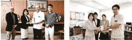
7月25日、株式会社池原建設より地域福祉振興基金へ寄付、8月7日、株式会社池原建設職員互助会より平成30年7月豪雨災害義援金への寄付がありました。ご厚志に感謝します。

6回スポーツ振興賞、スポーツ健康産業団体連合会 会長賞を受賞しました。) 大会期日：平成31年2月17日(日) 開催会場：沖縄県総合運動公園 種 目：フルマラソン(9時スタート) / 10kmロードレース(9時40分スタート) 参加料金：フルマラソン：6,000円(一般・陸連登録者)、5,000円(高校生・65歳以上) 10kmロードレース：3,700円(一般) 2,200円(高校生) 申込方法：窓口(おきなわマラソン事務局、沖縄銀行、コザ信用金庫) / コンビニエンスストア / インターネット 申込期間：9月1日(土)～12月