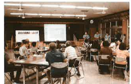
8月31日(金)高志保自治会