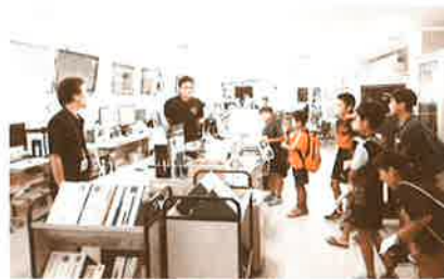
8月30日(木)渡具知自治会