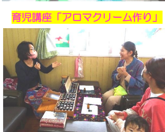
育児講座「アロマクリーム作り」