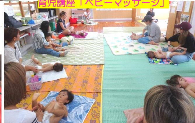
育児講座「ベビーマッサージ」