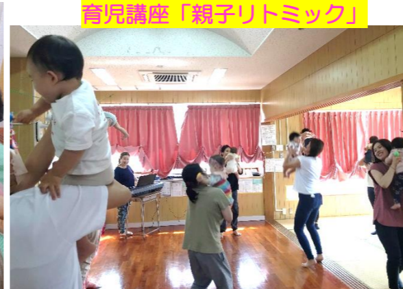
育児講座「親子リトミック」