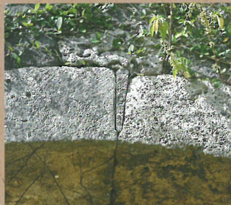
楔石(二层城郭的拱门)

一层城郭的拱门(内侧)是复制品,二层(前面的)城郭的拱门基本上是在当时拱门的基础上进行的修缮。