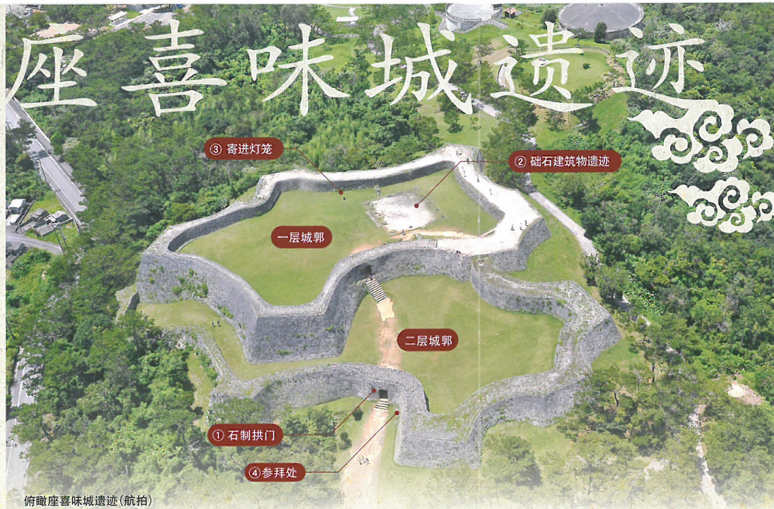
俯瞰座喜味城遗迹(航拍)

在一层城郭中找到了宽16米、进深14米的建筑遗迹。没有屋顶瓦砾出土,估计建筑物的屋顶采用了茅草或者板搭形式。