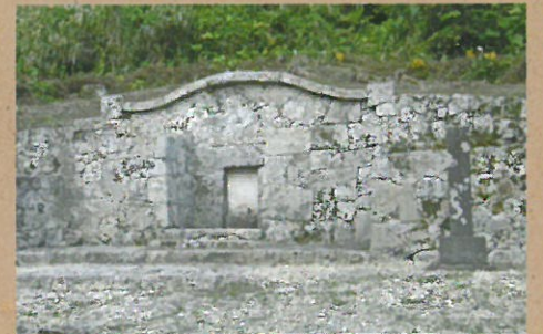
护佐丸之墓(中城村)

相传护佐丸于14世纪末出生在山田城(现在的恩纳村)。传言说当时拆了这里的城池墙壁后堆砌在座喜味城中。山田一带过去被称为“古读谷山”。